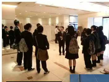
2日目班別研修 出発前