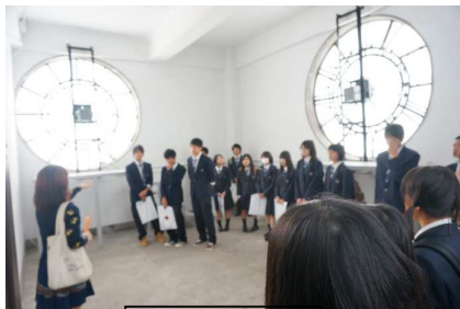
早稲田大学の見学

高校3年間の折り返し地点にきた2年生。次は進路に向けて本格的に取り組みましょう。