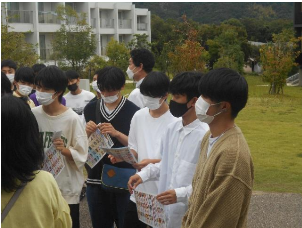
ハウステンボスに「入国」前の諸連絡を聞いています。