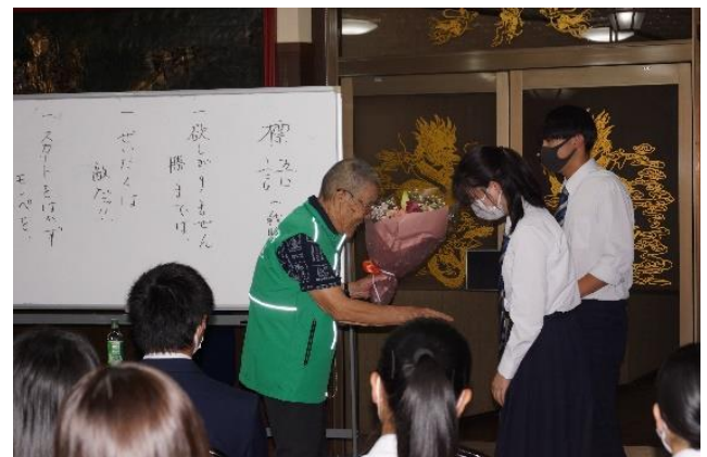
花束贈呈。ご講演ありがとうございました。