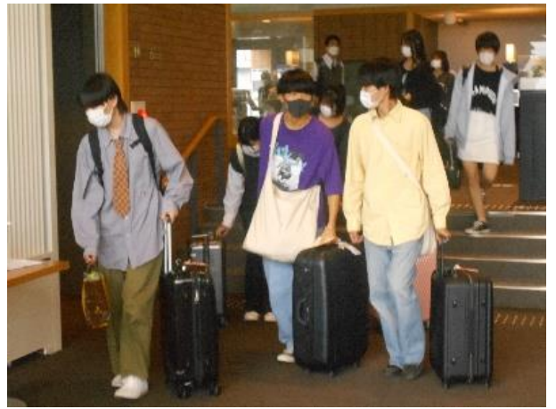
今日はどんな部屋かな？