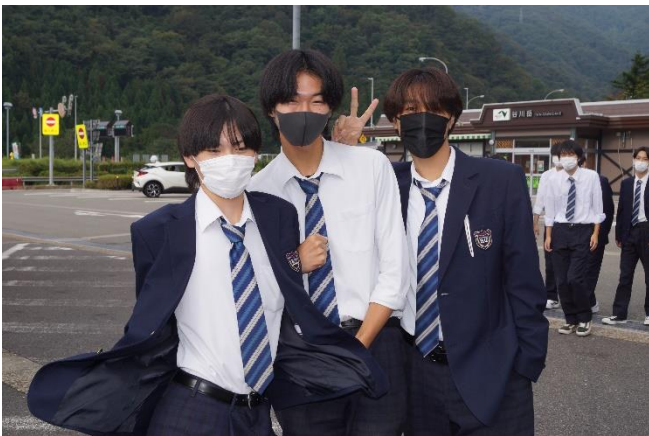
群馬県の谷川岳サービスエリアにて。左右とも。

今回は「班別自主研修」と「民泊」以外の場面を、主任が撮影した写真で振り返ります。