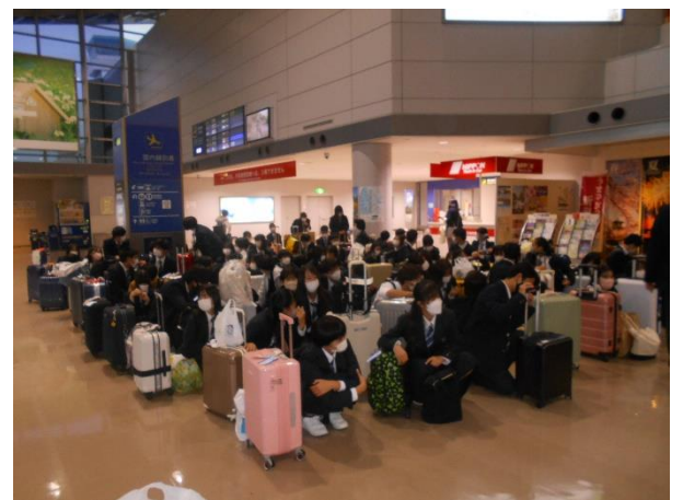
福岡空港にて。もうすぐ新潟行きの飛行機に乗ります。