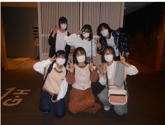
ハウステンボスでは、班別自主研修の時と同じメンバーで行動しました。2つの班を紹介します。