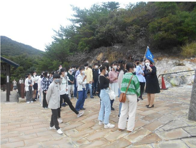
雲仙地獄にて。バスガイドさんによる説明中です。約45分かけて、蒸気が噴き出している道を歩きました。