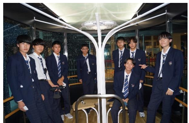
稲佐山展望台に向かうスロープカーの山麓駅(2020年完成)にて。スロープカーの内部の様子です。