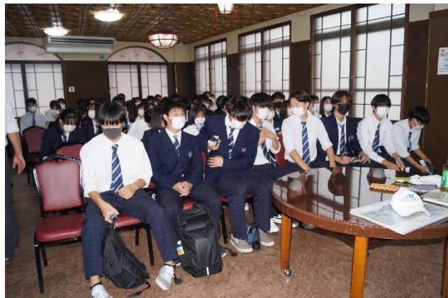
被爆体験講話会、講演会直前の様子です。