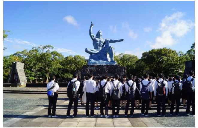
平和公園です。この後クラス写真を撮りました。