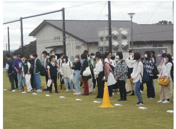
民泊、お別れ式直前。ありがとうございました。