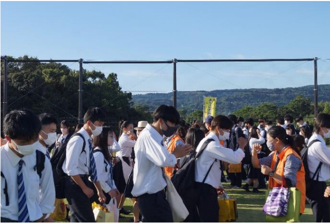
民泊、入村式。翌日の昼までお世話になります。