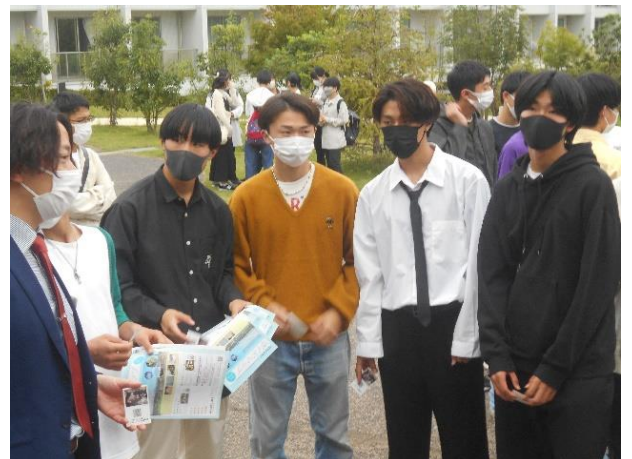
ホテルには、21:00までに戻ります。