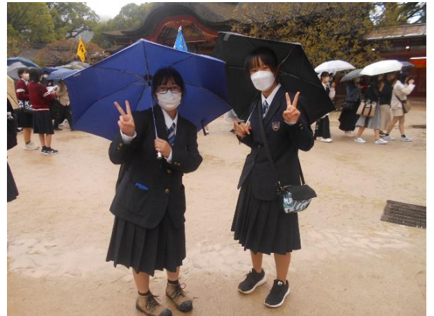
太宰府天満宮にて。今回、ここだけが傘が必要でした。