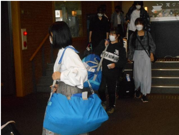
「変なホテル」チェックイン後、部屋に向かう途中です。