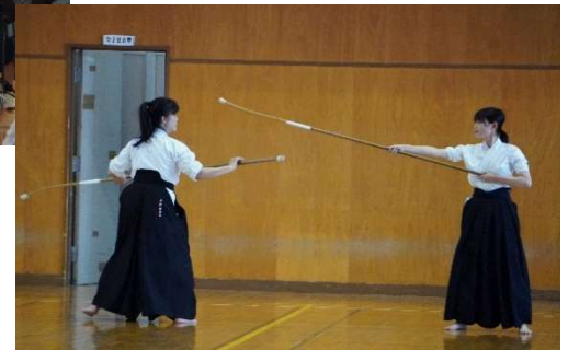
↓なぎなた部の演技